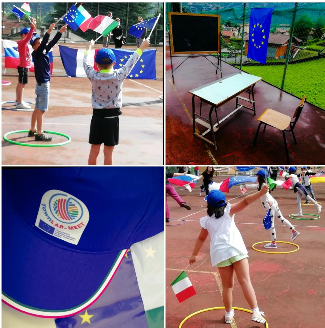
Fig. 1, 2, 3 e 4: alcuni momenti dell'evento del 13 giugno 2020 – Community dance

La partecipazione all'evento del 13 giugno è stata, infine, propedeutica ad illustrare il progetto Townlab_MEET e ad introdurre un'attività in cui il linguaggio universale e trasversale della musica ha permesso ai giovani di svolgere un ruolo da protagonista nello spettacolo dal vivo, favorendo la coesione, l'empatia e la condivisione grazie all'applicazione di una tipologia di arte performativa non convenzionale come la danza di comunità. L'evento ha fatto registrare una partecipazione complessiva di oltre 50 soggetti, tra studenti, genitori e rappresentanti delle istituzioni coinvolte dal progetto.