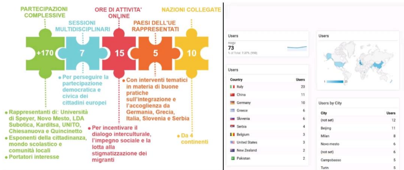
Fig. 9 e 10: indicatori di partecipazione rilevati sulle piattaforme GoToMeeting e Akkadu

Di seguito si riportano i dati analitici di partecipazione al meeting internazionale: